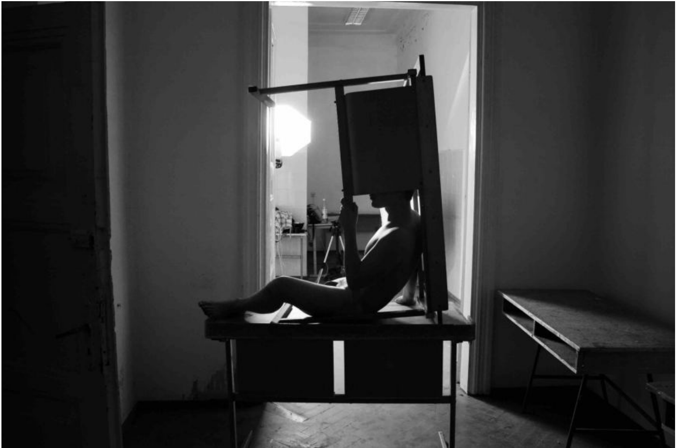
Remigijaus Venckaus paroda „Aš esu kitas“