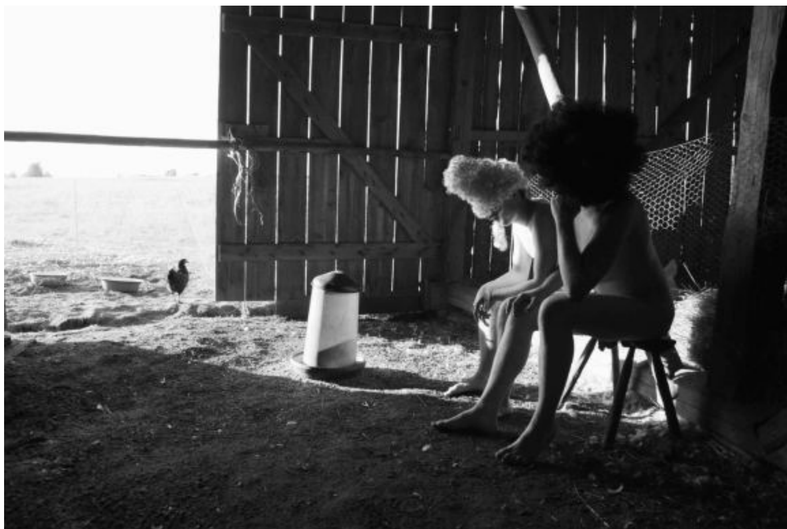
Remigijaus Venckaus paroda „Aš esu kitas“

Kai studijavau, piešdavom ir moteris, ir vyrus, ir senelius, ir paauglius. Mano akis prie nuogo kūno yra įpratusi. Neskirstau, ar kūnas yra gražus, ar negražus“, – sakė R.Venckus.