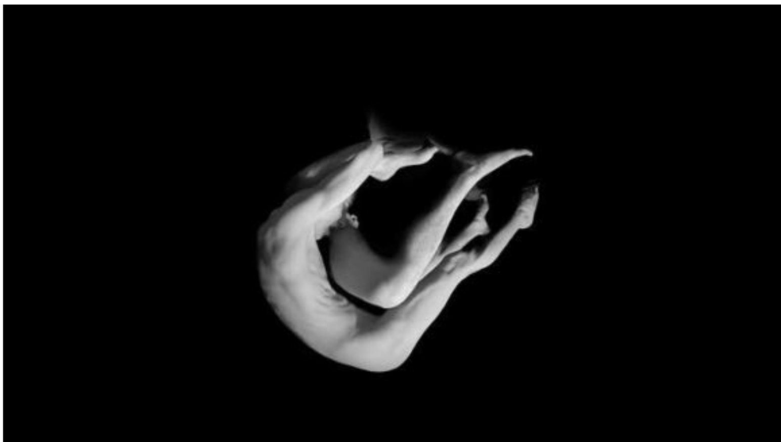
Remigijaus Venckaus paroda „Aš esu kitas“

Pabūkime kito kailyje ir pagalvokime apie toleranciją. Tas žmogus yra mūsų kaimynas, pažįstamas, turistai, pakeleivis ir tai nėra pretekstas neturėti pagarbos“, – sakė fotografas.