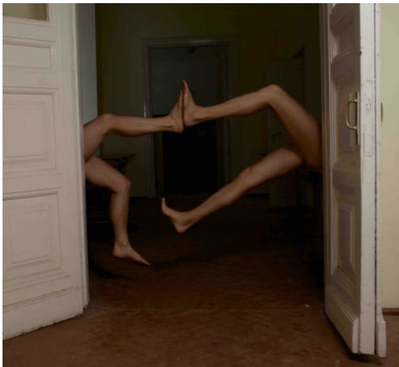
Remigijaus Venckaus nuotr. /Remigijaus Venckaus paroda „Aš esu kitas“

Todėl kūrėjas pats ėmėsi skaityti Bibliją ir sako atradęs ten labai gražių vietų.