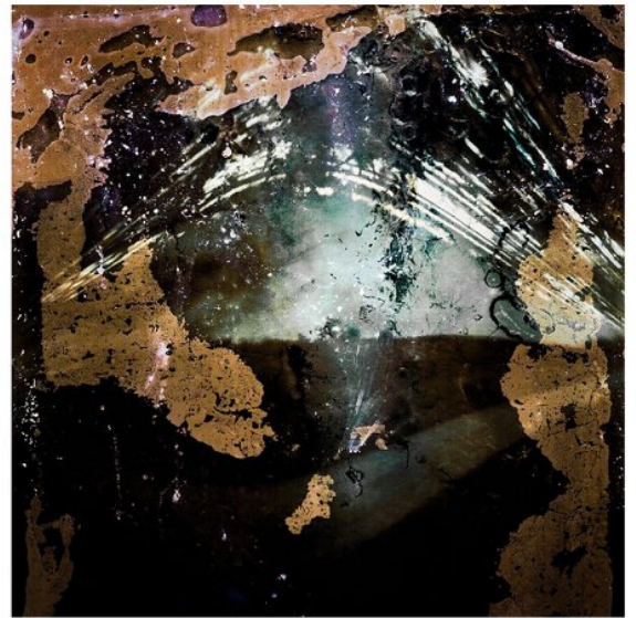
113 dienų. Iš serijos soliaografija. 2017m.

Pasirinkęs alternatyviąją fotografiją aš vis dar labai išsamiai ją domiuosi, pats analizuoju kūrybos procesą. Analitiškumas leidžia po daugybės šimtų bandymų sukurti savąjį ciklą, atsiranda savita specifiniai kriterijais grįsta vidinė atranka. Tai gi, fotografijos ciklai gimsta proceso analizės dėka, o sėkmės rezultatas – viešos parodos, kuriose randu savąjį auditoriją. Visa tai mane džiugina. Kūrybos procese reikšminga yra saulės šviesa, be kurios pagalbos aš nieko negaliu sukurti. Nuo saulės šviesos priklauso ir mano mėgstamiausių kūrybos technikų vystymas: cianotipija, liumenograma, pinhole, šlapias kolodiumas, gumbichro-