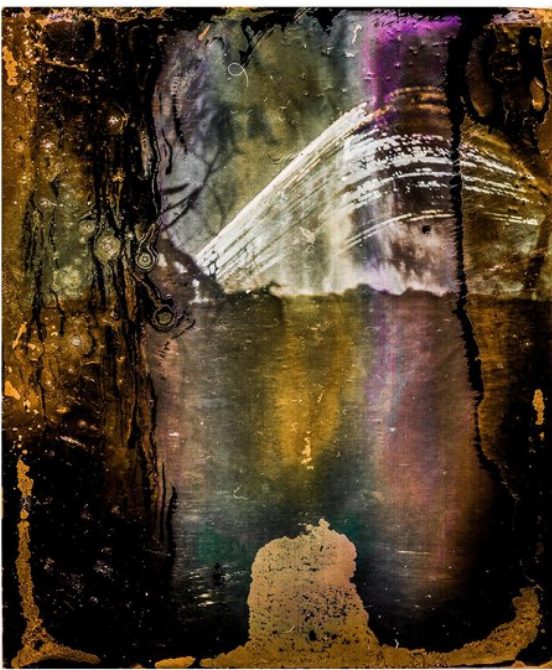
100 dienų. Iš serijos soliaografija. 2017m